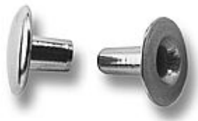
Nity dvojitěné s odlišnými otvory 2

» DOM, STAVBA, ZÁHRADA » DROBNÉ ŽELEZÁRSTVO